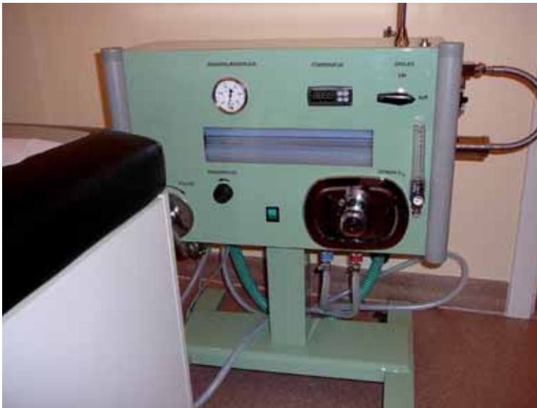
Aparato mecánico para la hidroterapia del colon, por desgracia montado demasiado bajo, lo que lo hace ineficiente.

El hidrodistribuidor automático para el colon (el aparato para la hidroterapia del colon) debe estar colgado en la pared y a la vista del paciente. Se realizan entre 30 y 40 lavativas consecutivamente, una detrás de otra, sin que el paciente se mueva de la camilla y sin que vaya al baño. Con esta terapia es posible, por primera vez, limpiar por completo y en profundidad el intestino grueso con sus muchas saculaciones (haustro del colon) hasta llegar al ámbito del intestino ciego.